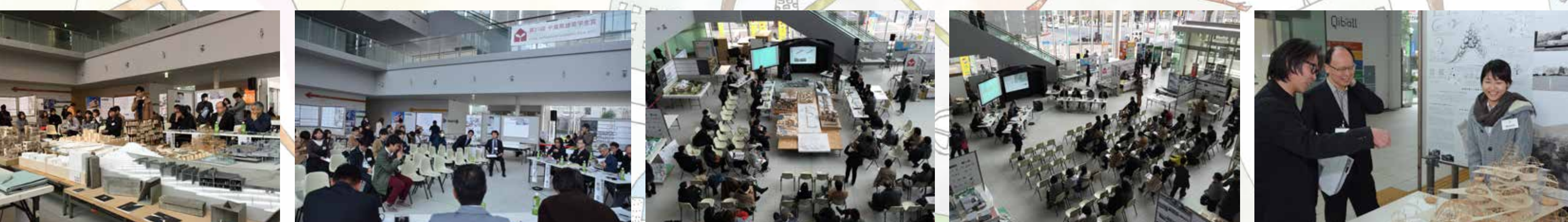
ポスターデザイン:坂本 裕太 (第25回出展:20世紀のトレース)